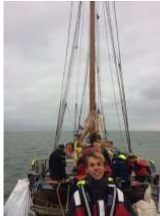
De loodjes die het zwaarst wegen

15.00 Terwijl ik wacht op monteur even update(tje), nieuws > geen nieuws, geen nieuwe foto's ontvangen, iedereen zal wel zitten te eten voor het straks los gaat. Op de Hollandia hopen ze om een uur of 4. Het is nu NAP op Terschelling maar nog -54 op Nes. Weerbericht tot 01.00 > West to Zuid-West 5-6, af en toe een bui, Van 01.00 tot 13.00 West to Zuid-West 5-6, ruimend Noord-West 4-5 met regen of bui.