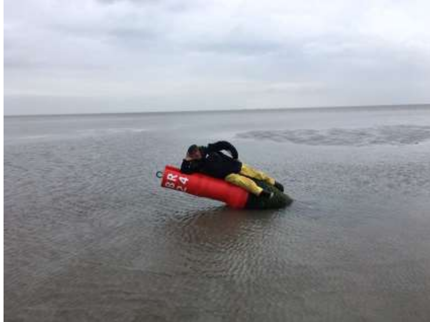
Wadmodel J.T. uit Z. in slagkledij op de BB